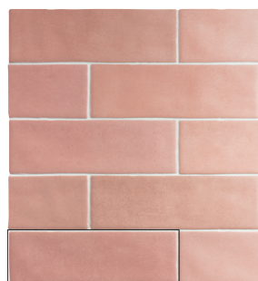
TOSCANA HOT PINK 6,5X20 / 2,5"X8" L50/M