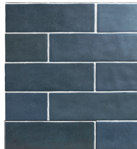
TOSCANA LAKE BLUE 6,5X20 / 2,5"X8" L50/M