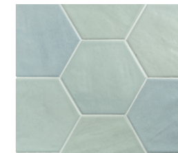
HEXA TOSCANA GHOST GREEN 13X15 / 5"X6" L51/M