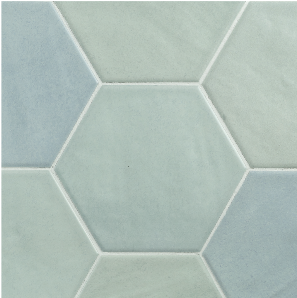
HEXATOSCANA GHOST GREEN 13X15