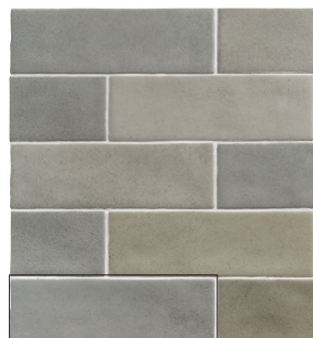
TOSCANA GRAY 6,5X20 / 2,5"X8" L50/M