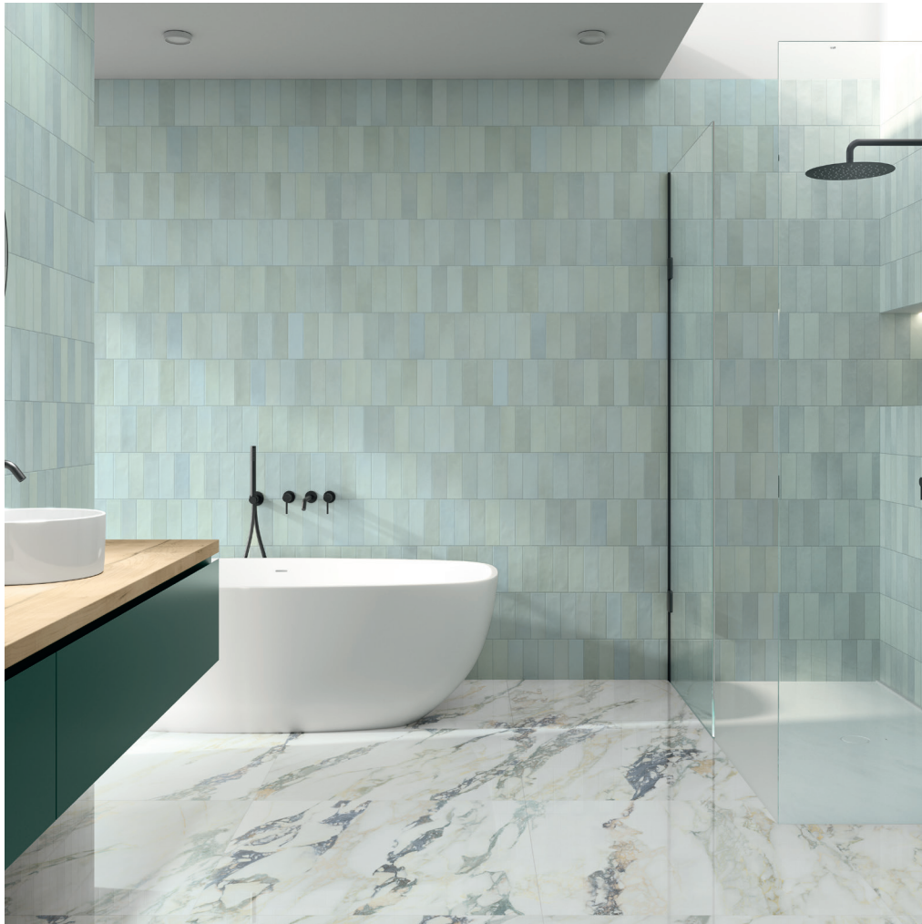
TOSCANA GHOST GREEN 6,5X20