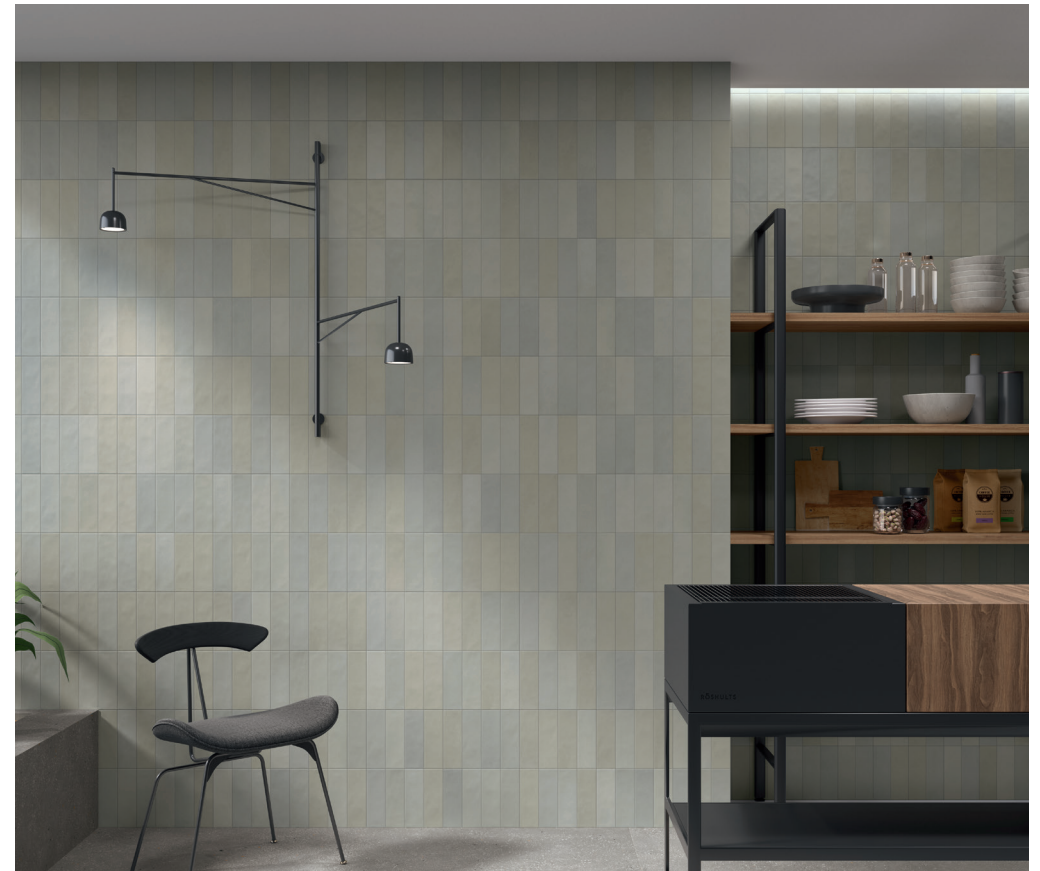
TOSCANA ASH 6,5X20