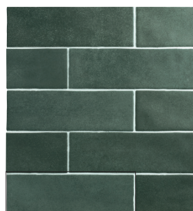
TOSCANA HERB 6,5X20 / 2,5"X8" L50/M