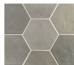
HEXA TOSCANA GRAY 13X15 / 5"X6" L51/M