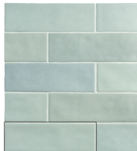
TOSCANA GHOST GREEN 6,5X20 / 2,5"X8" L50/M