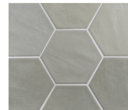
HEXA TOSCANA ASH 13X15 / 5"X6" L51/M