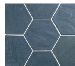
HEXA TOSCANA LAKE BLUE 13X15 / 5"X6" L51/M