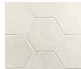
HEXA TOSCANA COTTON 13X15 / 5"X6" L51/M