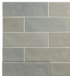
TOSCANA ASH 6,5X20 / 2,5"X8" L50/M