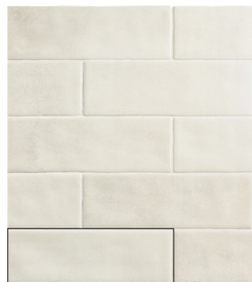
TOSCANA COTTON 6,5X20 / 2,5"X8" L50/M