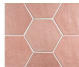
HEXA TOSCANA HOT PINK 13X15 / 5"X6" L51/M